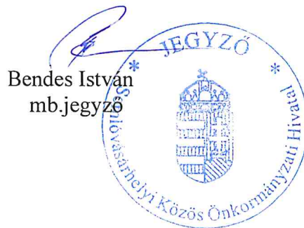
Bendes István mb.jegyző

A rendelet kihirdetve: 2019. március 28.